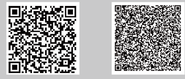
▲内観を360°パノラマで見る ▲マップ詳細はこちら